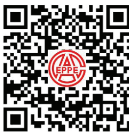
协会微信公众平台二维码