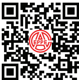
协会网站微信二维码