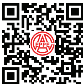
协会网站微信二维码